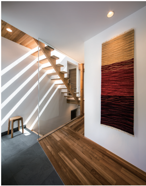
階段上のトップライトが玄関にもドラマチックな陰影を生み、癒やされる。帰宅した家族の気配は、階段越しにリビングへも伝わる