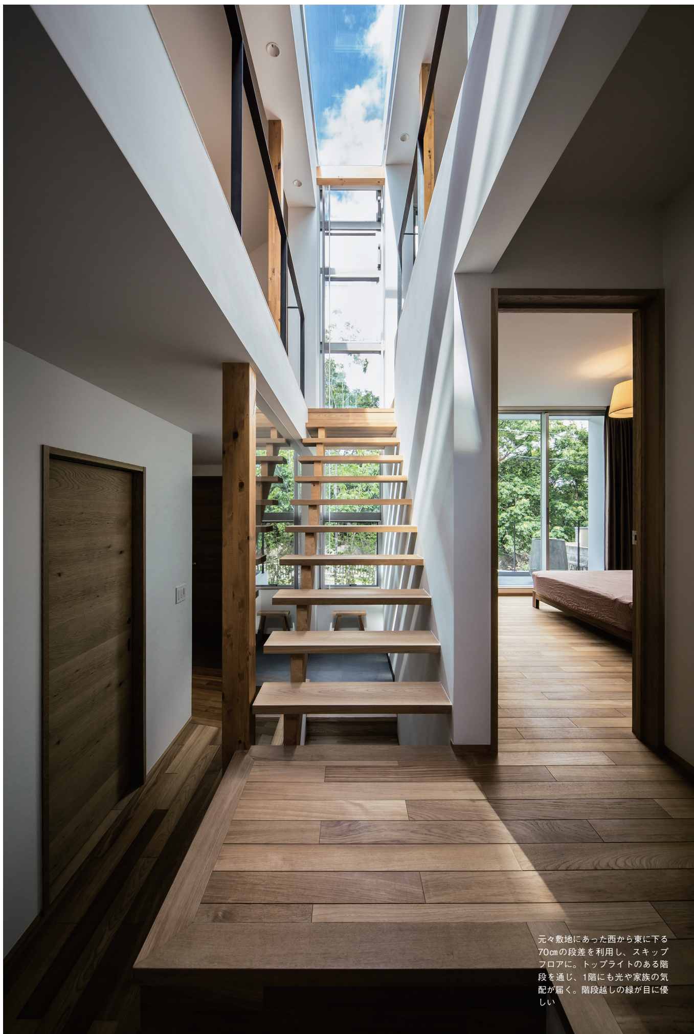
元々敷地にあった西から東に下る70cmの段差を利用し、スキップフロアに。トップライトのある階段を通じ、1階にも光や家族の気配が届く。階段越しの緑が目優しい